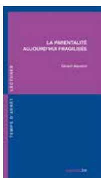
La parentalité aujourd'hui fragilisée (Gérard Neyrand)

L'attention à l'autre repose sur une position éthique, le développement d'un accueil, d'une réceptivité ou hospitalité particulières à l'autre et à soi. Comment apporter une aide sans attendre de retour ? Comment ne pas se laisser envahir ou manipuler par l'autre ? Comment ne pas passer à côté de souffrances peu visibles ?