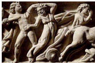
Œdipe tuant Laïos suite à un malentendu