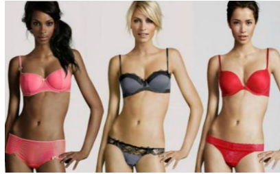
H&M provoque le scandale en utilisant des corps de synthèse pour les mannequins de sa nouvelle campagne de publicité